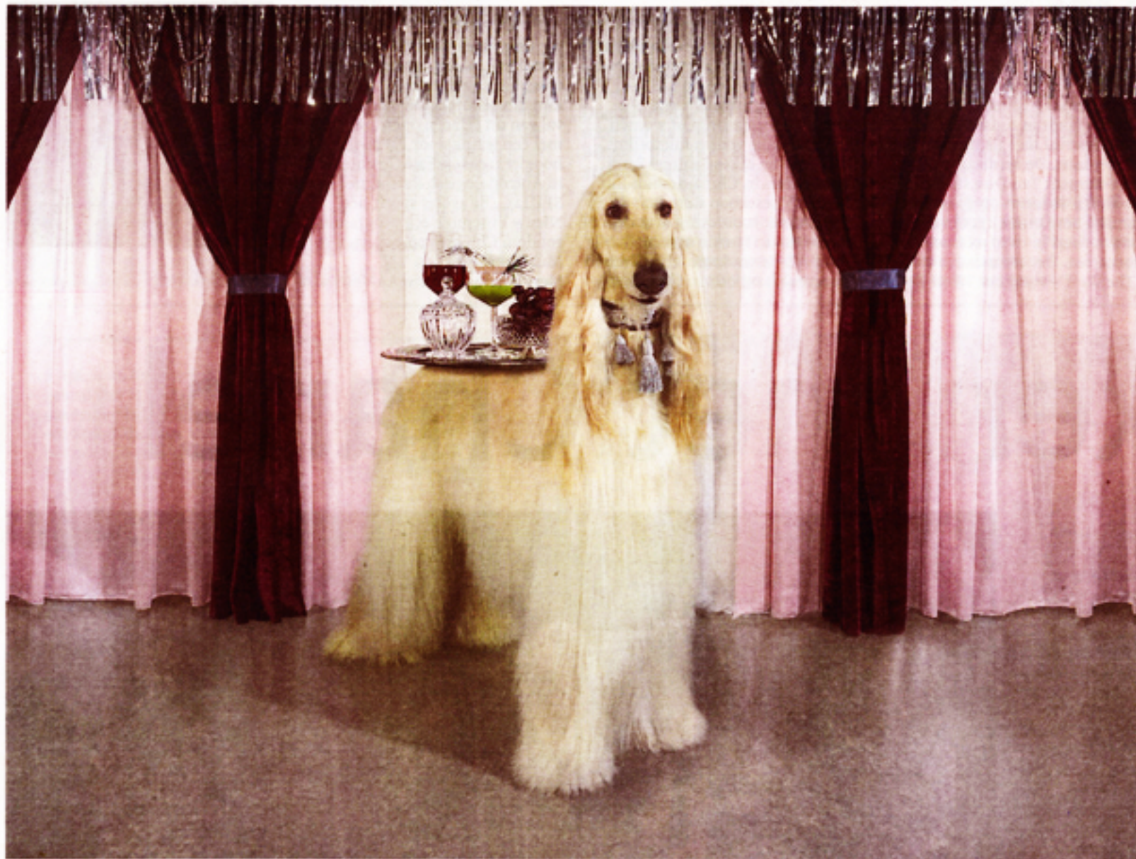
In de serie 'Overwelming love' van Michelle Bours spelen honden de hoofdrol.